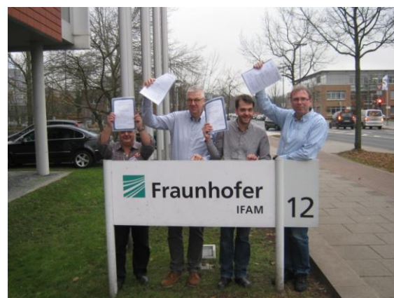
Het welverdiende diploma European Adhesive Specialist 20 december 2012

De acht modules worden met zeven schriftelijke (Nederlandstalige) toetsen geëxamineerd. Deelname aan de practicumtoets is facultatief. De opleiding wordt in z'n geheel getoetst met een mondeling examen (waarschijnlijk Engelstalig). Als ook deze succesvol is verlopen, dan ontvangt de deelnemer het diploma EWF 517-1 European Adhesive Engineer.